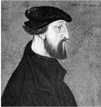
Simon Grynaeus (gouache, papíron, 1530/1550)

Mindenek előtt köszönetet mondok a lehetőségért, hogy a Budavári Hírmondóban is beszámolhatok a Simon Grynaeusszal (1494/95–1541) kapcsolatos kutatásaimról.