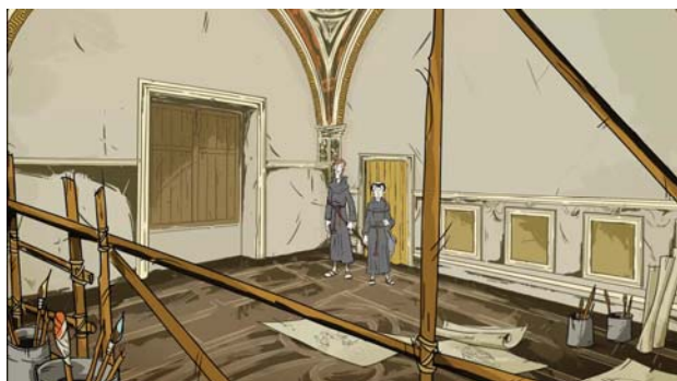
Reformációi lapszámunkban szereplő grafikák Richly Zsolt Luther-rajzfilmsorozatának „Úton az Úr felé” című 4. epizódjából valók.