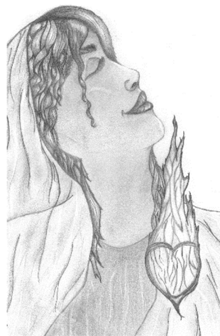
A személyes hit születése

A Szentlélek felébreszti a szívünkben az Isten iránti buzgalom, szeretet legmélyebb érzését.