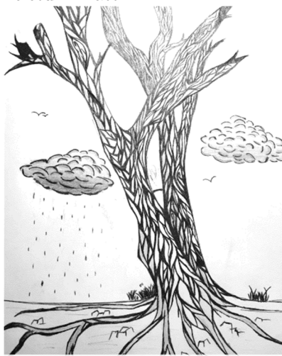
A gyökér, amely élte