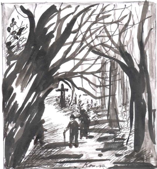
Az örök élet felé