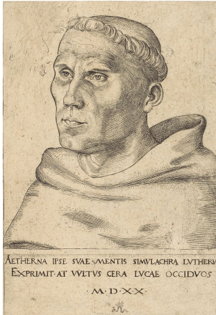
Lucas Cranach: Luther 1520-ban

1520-ra a Német-római Birodalomban kialakult az evangéliumi mozgalom az ezer számra közkézen forgó röpiratok révén. A reformációs mozgalom gerincét a humanista műveltségű városi polgárság jelentette. A kezdeti véleménykülönbségek után kialakult a wittenbergi professzorok köre. A mozgalom középpontjában azonban egyedül Luther állt.